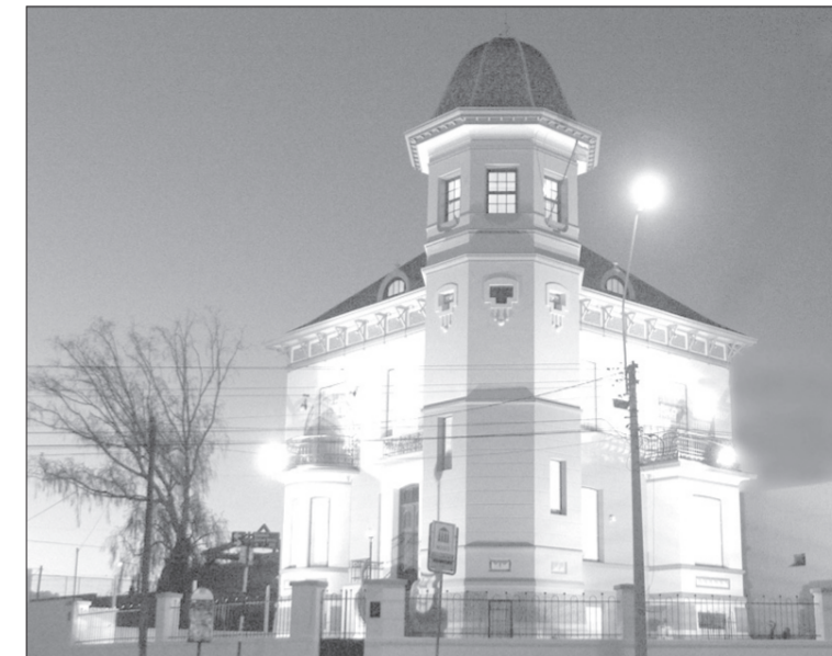
► El Museo de Ciencias Naturales y Oceanográfico del Chubut, el de la familia Perón y el Museo del soldado de Malvinas, de Puerto Madryn, Camarones y Rawson respectivamente, ofrecerán distintas actividades a la comunidad. Este año, el lema es "Museos en un mundo cambiante - Nuevos retos, nuevas inspiraciones".

Por ello, la Secretaría de Cultura, a través de la Dirección General de Gestión, Investigación y Patrimonio Cultural propone actividades de aprendizaje y recreación que apuntan a atraer a los niños y jóvenes a las exposiciones y labores propias del mundo de los museos.